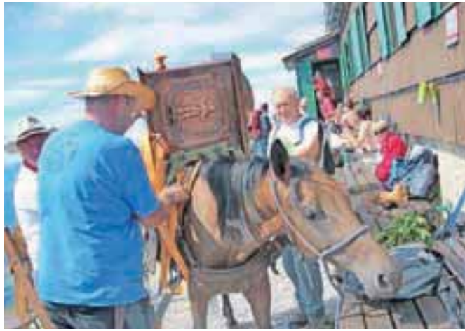
Letošnji simbol, kavni mlinček neobičajne velikosti, je bil nekoliko pretežak in preneroden za nošnjo do Prešernove kočje. Na pomoč je priskočila potrpežljiva kobila.