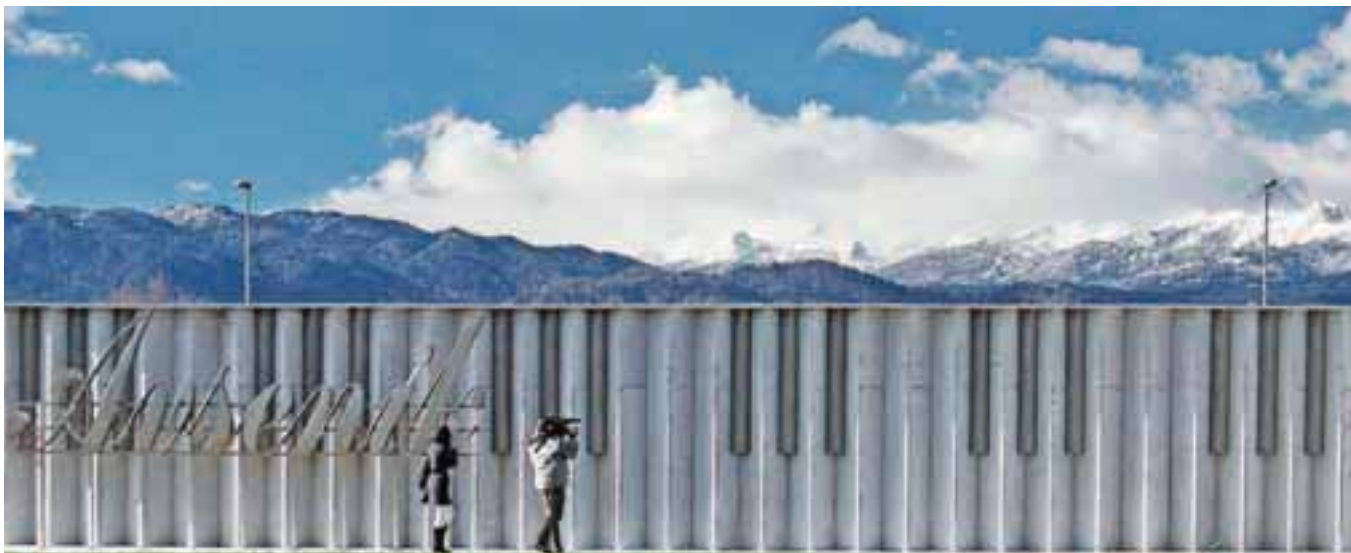
Nova perspektiva, avtor Žarko Petrovič (diploma)