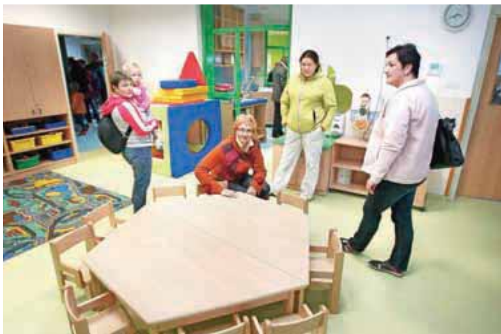
Leška enota je med vsemi radovljiškimi vrtci najdlje odprta. Prvi otroci v varstvo pridejo že ob 5. uri in 15 minut, zadnji odidejo ob 16.30.

Občina Radovljica, Občina Žirovnica in SZ Radovljica, Bled, Bohinj, Gorje