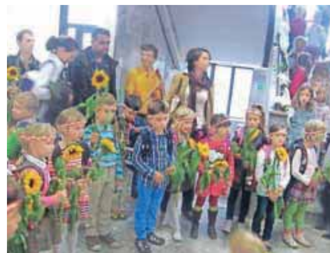
V Waldorfski šoli v Radovljici je letos petnajst prvošolcev.

Petnajst prvošolčkov je letos sedlo tudi v klopi Waldorfske šole v Radovljici. Na slavnostnem popoldanskem sprejemu je vsak od njih dobil sončnico, deteljico za srečo in plateni venček. Na široko pot znanja so jih pospremili učenci drugega in tretjega razreda Waldorfske šole, ki so jim s svojimi učiteljicami pripravili lep kulturni program.