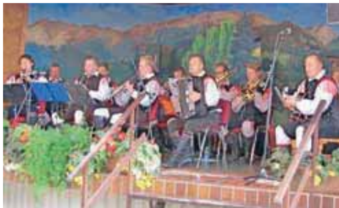
Pihalna godba Glasbene šole Avsenik na koncertu na vrtu Jožovčeve gostilne