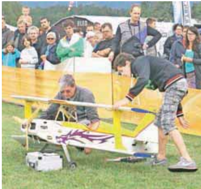
Predstavili so se modelarji iz cele Slovenije in sosednjih držav.