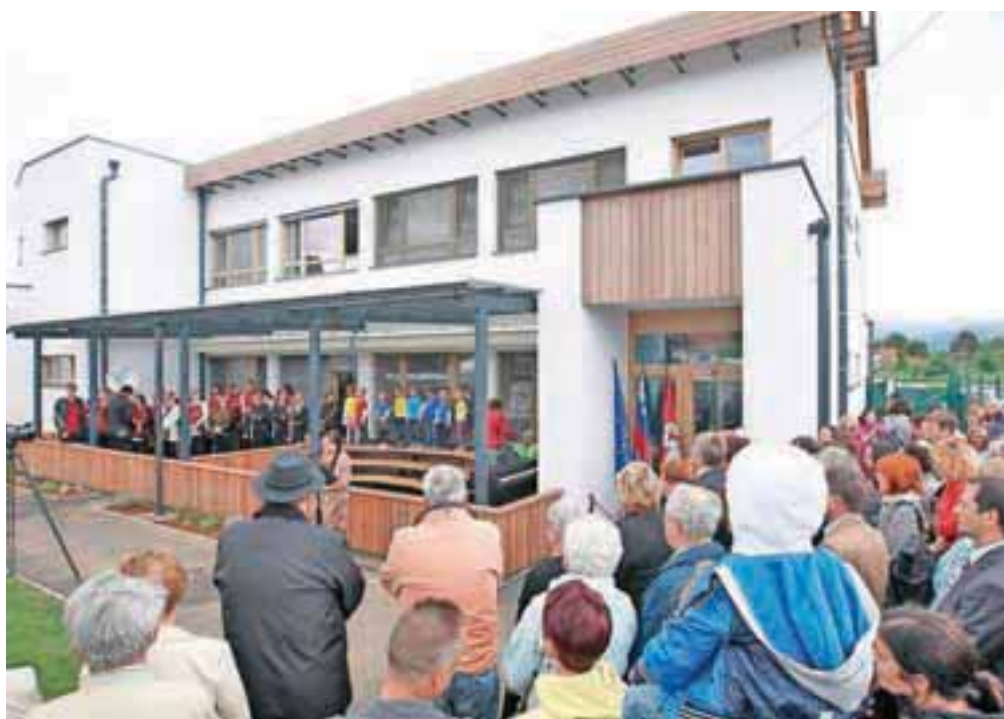
V ponedeljek so otroci iz Lesc prišli v novi vrtec.

Gradnja prizidka vrtca je bila končana junija, rekonstrukcija obstoječih prostorov pa konec avgusta, tako da od 1. septembra vsi vpisani otroci lahko obiskujejo obnovljene in nove prostore. Uporabno dovoljenje za prizidek je bilo pridobljeno junija, za rekonstruirane prostore stavbe vrtca pa konec avgusta.