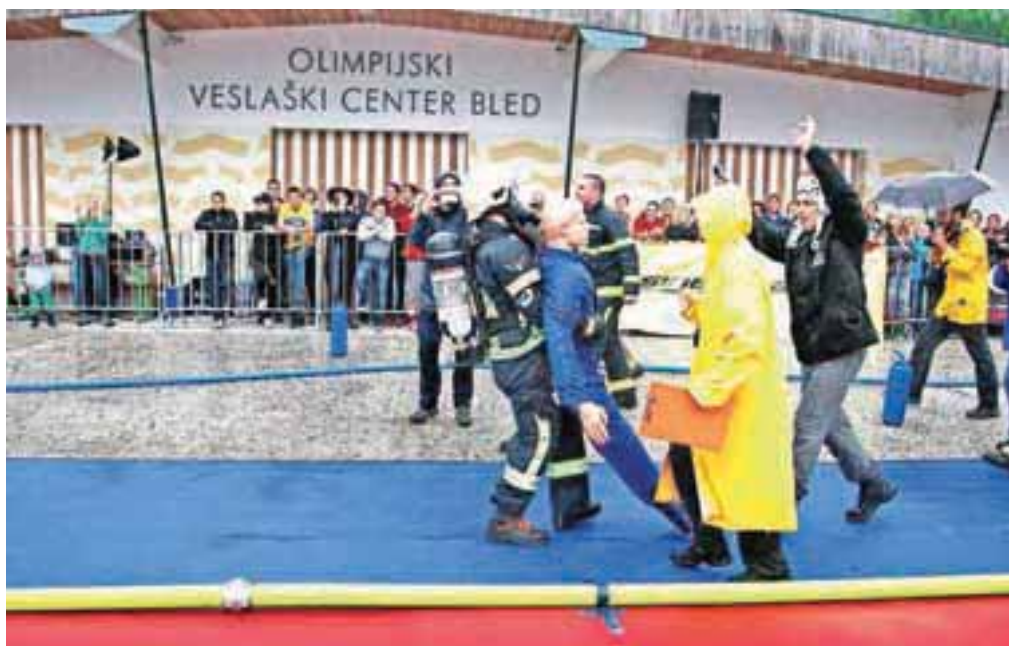
Proga je bila v deževnem vremenu še bolj zahtevna kot sicer.

je bil na cilju kljub utrujenosti nasmejan do ušes. Verjame, da mu bo novembra na svetovnem prvenstvu v Phoenixu v Arizoni spet uspelo doseči rezultat pod 1,30, kar mu je na dosedanjih tekmovanjih uspelo že dvakrat. Pred njim, pravi, sta še dva meseca intenzivnih priprav, saj tri- do štirikrat na teden trenira na progi, ob tem pa opravi še dva do tri dodatne treninge. Prav zaradi tega lahko stopi ob bok najbolje pripravljenim svetovnim profesionalcem. To tekmovanje namreč v Ameriki predstavlja kvalifikacije za sprejem med profesionalne gasilce, pri nas pa se ga v glavnem udeležujejo prostovoljni gasilci. »Njihova psihofizična pripravljenost je prednost pri delu, ki so mu predani. To ni zgolj šport ali interesna dejavnost, to je način življenja,« je poudarila predstavnica organizatorja za odnose z javnostmi Monika Golob.