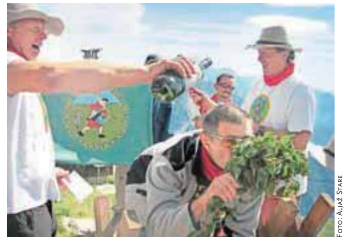
Pridobivanje večne mladosti je zahteven podvig. Po vzponu na Stol se je potrebno »pozdraviti« s šopom kopriv, pomočiti z nekaj rujnega, pa tudi čez rit kakšna pade.

kgz Sava KMETIŠKO GOZDARSKA ZADRUGA 2008