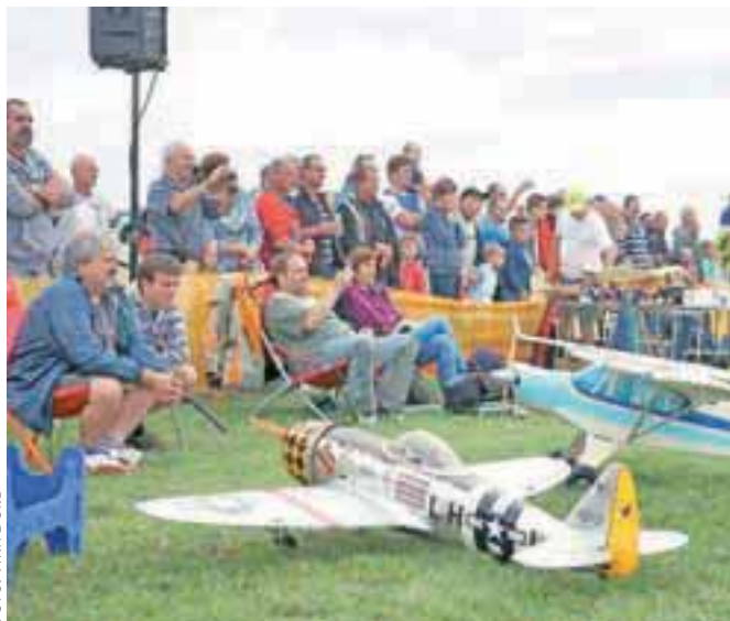
Miting malega letalstva si je tudi letos ogledalo veliko ljudi.

V letališkem hangarju so modelarji razstavljali svoje modele, se družili in predstavljali letenje z radijsko vodenimi modeli letal. Miting malega letalstva si je tudi letos ogledalo veliko število ljudi, ki so bili navdušeni nad akrobacijami, ki so jih modelarji s svojimi letečimi maketami izvajali v zraku.