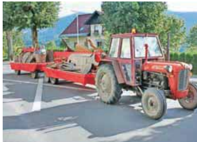
Večno mladi fantje so v letošnji povorki s seboj ponesli tudi vseh štirideset dosedanjih simbolov pohodov na Stol, največje pa je popeljal traktor nekoliko starejšega datuma.

Jubilej so večno mladi kot po tradiciji nadaljevali v popoldanskih urah v prireditvenem prostoru za centrom Spar. Še prej so se, kot veleva tradicija, Radovljičanom predstavili v povorki, ki je krenila z Linhartovega trga. V njej so poleg pohodnikov sodelovali kolesarji in avtomobilisti starodobniki, povorko so »uglasbili« pihalni orkestri iz Lesc, Gorij, hrvaških Babičev in Musikvereina Ansfelden iz sosednje Avstrije, nastopile so domače mažoretke, na ogled pa je bilo tudi vseh štirideset dosedanjih simbolov. Po nastopih pihalnih orkestrrov je za zabavo posrbel Ansambel Gregorji.