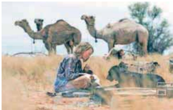
Za uvod v novo sezono: gledališka predstava in projekcija filma Poti .

Ob slovesu od poletja in za zagon nove sezone v Linhartovi dvorani pripravljamo dva dogodka, katerih ogled bo brezplačen. Najprej bo na vrsti gledališka predstava Herbolaria – Rastlinjarka v izvedbi KUD Radovljica – Linhartov oder, drugi dogodek pa bo projekcija filma Poti , ki smo ga izbrali za predstavo ob odprtju sezone tako zaradi njegovih filmskih kvalitet kot tudi v slovo od vseh poletnih poti. Film je bil posnet po knjižni uspešnici Robyn Davidson in sledi avtoričinem potovanju; Davidsonova se je sredi sedemdesetih let, naveličana sodobne družbe in življenja v mestu, odločila prehoditi 2700 kilometrov dolgo pot čez