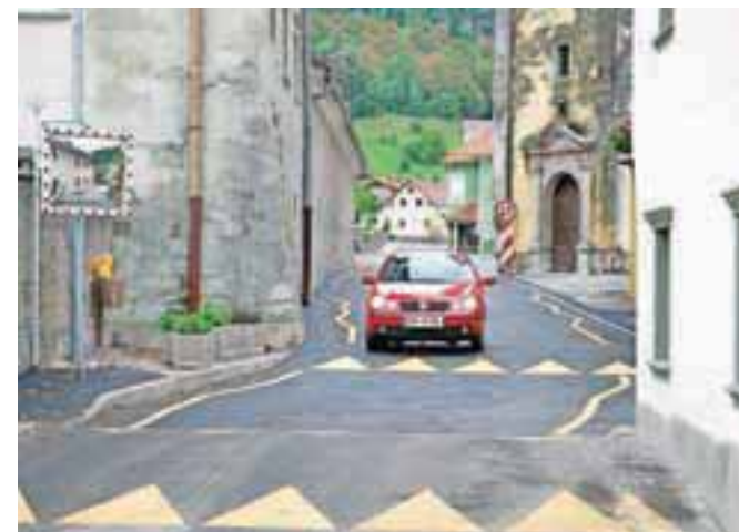
Cesto skozi središče Begunj, ki je bila zaradi gradnje kanalizacije vse poletje zaprta, so prejšnji konec tedna spet odprli.

Konec prejšnjega tedna je spet stekel promet skozi središče Begunj, ki je bilo vse poletje zaprto zaradi gradnje kanalizacijskega omrežja. Gorenjska gradbena družba je pospešeno zaključila dela na državni cesti mimo Psihiatrične bolnišnice; odsek ceste je bil tako že pretekli petek prenovljen in asfaltiran, v soboto pa so ga spet odprli za promet.